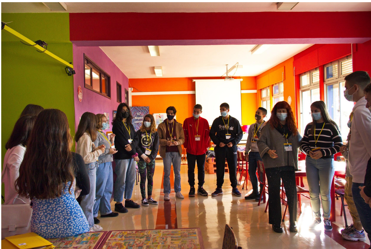
Παιχνίδια Γνωριμίας στο Πορτογαλικό Σχολείο