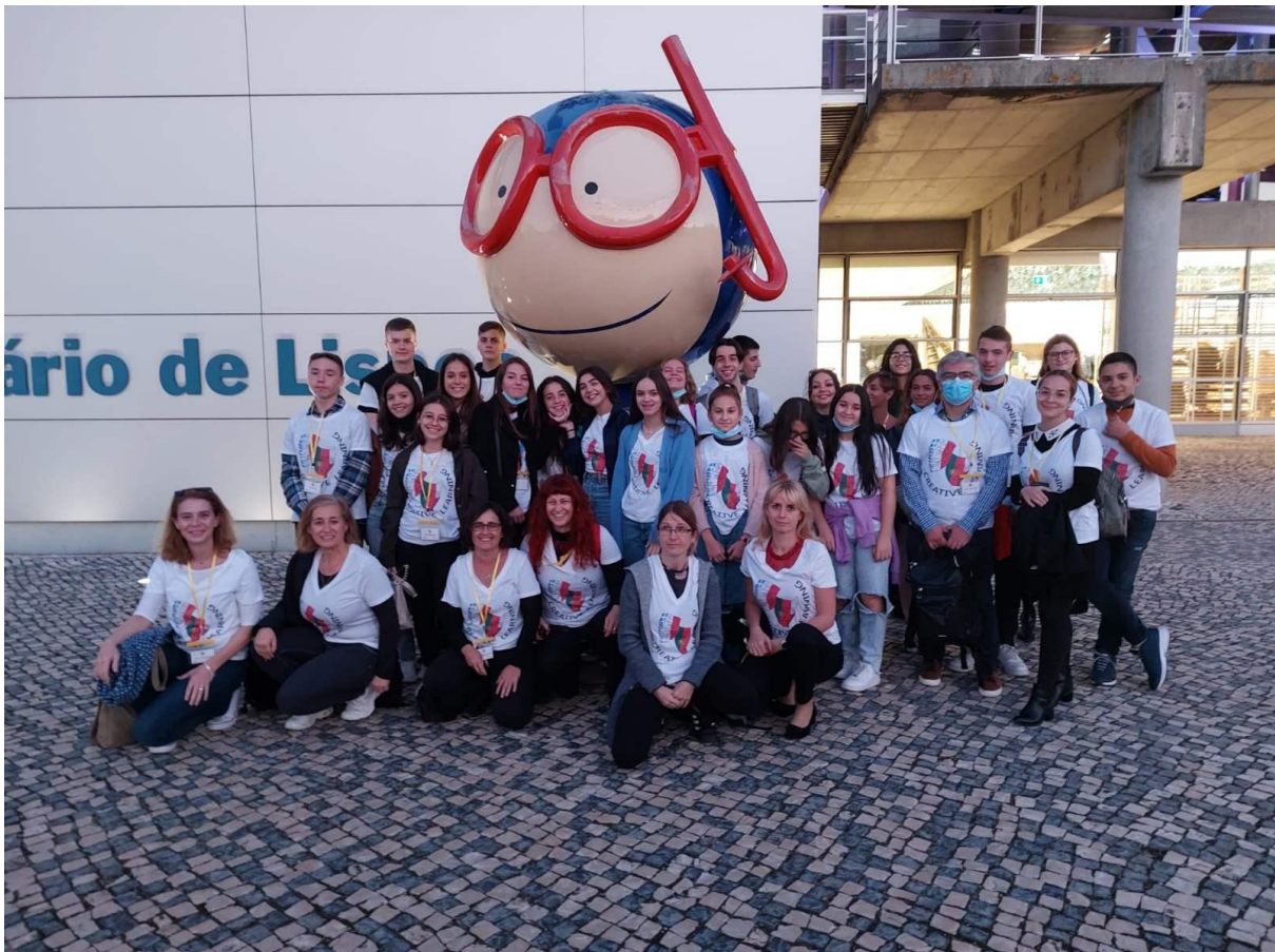
Εκδρομή στο μεγαλύτερο ενυδρείο της Ευρώπης

Μετά από όλες αυτές τις πρωτόγνωρες εμπειρίες, μαθητές και εκπαιδευτικοί του 10ου Γυμνασίου Ηρακλείου αναμένουν με χαρά την επόμενη συνάντηση τον ερχόμενο Απρίλιο στην Πολωνία, όπου θα εργαστούν στην κατασκευή των σκηνικών της θεατρικής παράστασης. Και τέλος, με ακόμη μεγαλύτερη ανυπομονησία περιμένουν την πραγματοποίηση της θεατρικής παράστασης στη Μάλτα τον ερχόμενο Ιούνιο, όπου η ελληνική ομάδα θα τιμήσει τον Μίκη Θεοδωράκη!